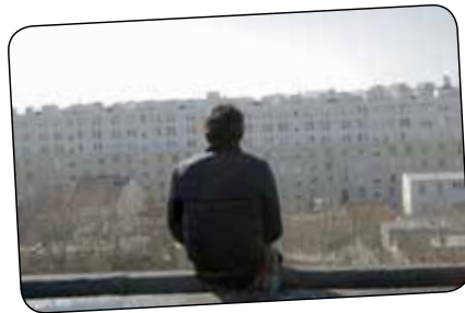
4 FROMAGES de David Chausse Court-métrage fiction