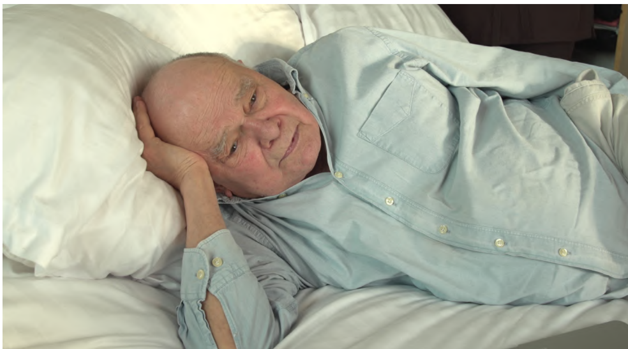
Pendant qu'il est trop tard